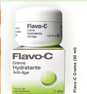
Flavo-C Crème (30 ml)