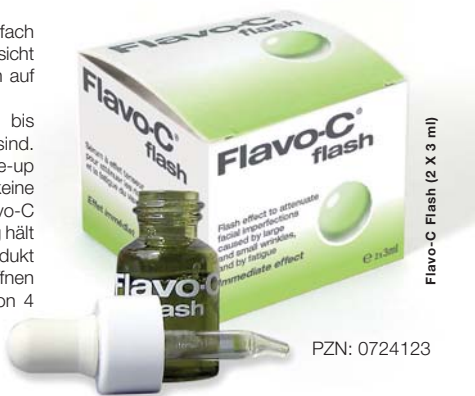
Flavo-C Flash (2 X 3 ml)