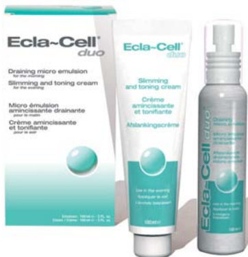
Ecla-Cell Duo (2 x 100 ml)

Creme: Koffein, Silicium, Extrakt von grünem Tee, Seeealgen und Kletterfeue