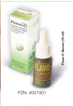
Flavo-C Serum (15 ml)